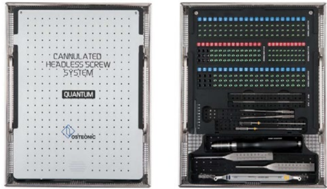
D9Q.01010 (la cassetta viene fornita senza strumenti)